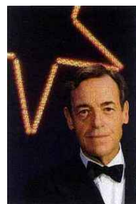
Lindsay Owen-Jones, vingt-trois ans à la tête de L'Oréal.

■ Le 17 mars, pour son dernier jour chez L'Oréal - et celui de ses 65 ans -, Lindsay Owen-Jones partira sans bruit. Le patron du leader mondial des cosmétiques organisera un pot en toute simplicité, entouré seulement de ses plus proches collaborateurs et de ses assistantes.